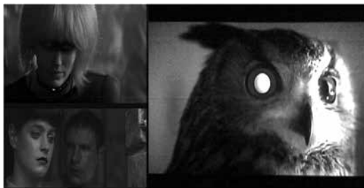
Слика 2 Репликанткиње Прис и Рејчел и „вештачка сова” са црвеним одсјајем у очима

глас звучи механички и синтетизовано, подразумеваће се да је у питању вештачки систем, напротив ако машина има природан људски глас, може проузроковати неочекивану конфузију. 3 Ово је важна лекција за дизајнере који креирају хуманоидне 3Д анимације, роботе и виртуелне агенте. Људи могу комфортно да прихватају сличности објеката са људима све док сличност не постане толико снажна да се више не региструје као ствар која делује људски, већ делује као људско биће са којим нешто није у реду. 4 Овај концепт је 1970. идентификовао јапански професор роботике Маширо Мори и назвао га Bukimi No Tani , који је касније преведен на енглески као uncanny valley (долина сабласности) и данас је у широкој употреби. 5 Ефекат се односи на различите репрезентације: глас, слику, гестове, пропорције и друго. Дакле, Џеј Еф Себастијанове играчке имају добро дизајниране гласове, јер због синтетизације делују мање сабласно.