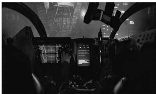
Слика 5 Унутрашњост „Спинера” са таблом за навигацију и додатним екранима.

увек није реализована. Поред ове, још једна технологија из филма није реализована, а то су летећи аутомобили – спинери које је за филм осмислио Сид Меад (Syd Mead), дизајнер који је радио и на филмовима „Трон” и „Осми путник” (Alien). Спинери су могли да се возе по земљи, али и да лете у ваздуху. Користили су се као патролна возила или као приватна возила богатих људи. Сид Меад је био концептуални уметник на филму, односно био је задужен за дефинисање атмосфере и простора филма, укључујући и бројне интерфејсе. Режиер Скот Ридли је лично направио неке скице у пред-продукцији за атмосферу филма по узору на слику Едвара Хопера „Ноћне птице” и радова француског стрип цртача Жана Жироа-Мебијуса (Jean Giraud - Moebius) коме је понуђена сарадња у пред-продукцији али ју је одбио због ангажовања на другом пројекту. 10