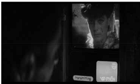
Слика 4 Видео позив – Декард и Рејчел

У филму се дизајнери визуелног интерфејса и даље држе зелених екрана и фонтова који су типични за ране компјутере, а монитори су катодни екрани што се може објаснити сценографским решењем које се уклапа у ретро-футуристичку естетику филма. Телефонски позиви у филму су подржани и видео сликом, а у филму Декард обавља разговор из јавне говорнице у бару. Број окреће ручно притискајући дугмиће. Видео-фон је стари концепт, али је почео масовно да се употребљава тек од 2003. са појавом Скајпа (Skype). Један од првих примера најаве ове технологије се може видети у илустрованом алманаху француског новелисте и илустратора Албера Робиде из 1890. године: „Двадесети век, Електрични живот” ( Albert Robida – Le Vingtième siècle. La vie électrique ). 9