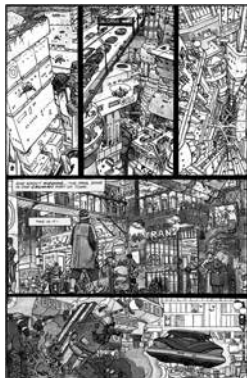
Слика 7 Мебијусови цртежи из стрипа The Long Tomorrow , Извор: https://www.reddit.com/r/Moebius/comments/awughn/the_long_tomorrow_1977/

доминира зграда Тајрел корпорације. Посебно импресивне сцене у Блејд Ранеру су сцене града у којима се преко целих небодера налазе екрани на којима се емитују рекламе.