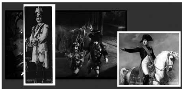
Слика 1 Сцена из филма са „играчкама” репликантима Кајзера и Наполеона и њихови ”оригинали”.

У филму Блејд Ранер машине су андроиди, односно репликанти и оне имају у потпуности људске особине тако да је интеракција са њима природна, односно не постоји интерфејс, јер не постоји ни начин да их разликујемо од људских бића. Комуникација се обавља вербалним или невербалним путем. У филму постоје и андроиди нижег типа које упознајемо у сцени када репликанткиња Прис (Дерил Хана) посећује генетског инжињера Џеј Еф Себастијана (Вилијам Сандерсон). При уласку у његов стан дочекују их андроиди „играчке”, патуљасте војници, које је Џеј Еф Себастијан сам дизајнирао да се не би осећао усамљено. Један има главу кловна са издуженим носом и подсећа на пародију пруског краља Вилијема Кајзера, а други има главу медведа и обучен је у униформу Наполеона. Обојица имају механичке покрете, крећу се незграпно, па чак се и сударају. Они делују мање људски, а више као роботи, карикатуре два диктатора (Слика 1).