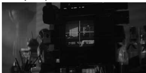
Слика 3 Еспер машина